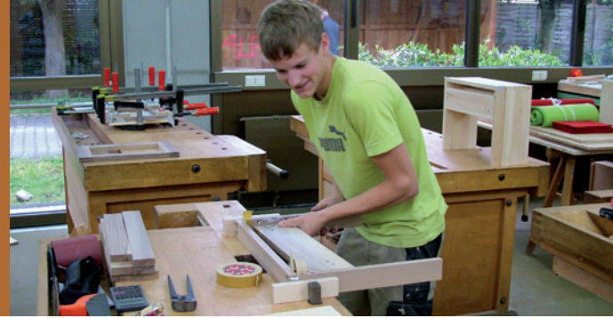
2. / 3. Lehrjahr